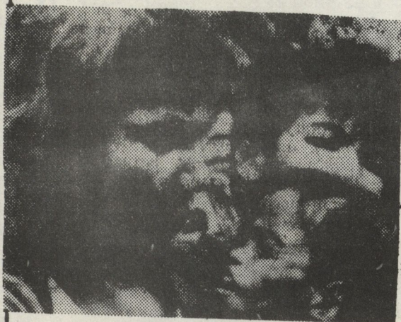
มองจาก กรุงเทพฯ

(แปลและถอดความมาจากบทความเรื่อง Deathwatch: Cambodia โดย Marsh Clark หัวหน้าสำนักงานใหม่ในฮ่องกง คีพิมพ์ในนิตยสาร Time ประจำวันที่ 12 พฤศจิกายน พ.ศ.2522)