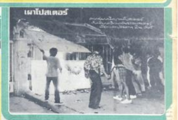
2สท. วิจัยปมใส่พท. กับพม. จับ