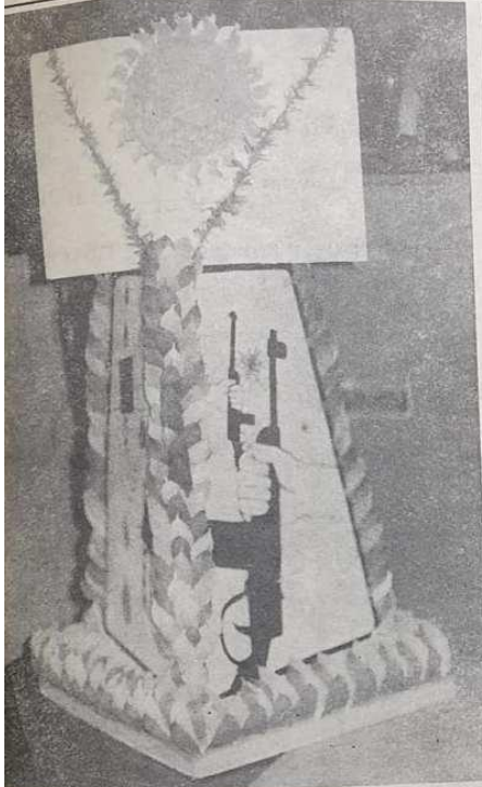
หนึ่งในบรรดากระทงที่ส่งเข้าประกวดในงาน "ลอยกระทงรักไทย" ที่มหาวิทยาลัยธรรมศาสตร์ เมื่อวานนี้.