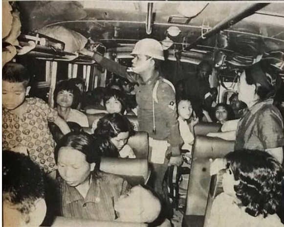
เจ้าหน้าที่ทรว ต้ารวจ ตั้งต่านตรวจคั้นอาวุธ และประชาชนผู้เดินทางเข้า ออกกรุงเทพฯ เพื่อป้องกันเหตุร้ายที่อาจจะเกิดขึ้นอย่างเคร่งครัดตามจุดต่าง ๆ ตลอดเวลาตามคำ ร้องขอคณะปฏิรูปการปกครองฯ ในภาพเป็นการตรวจค้นตามปกติที่ด่านบริเวณรังสิต เมื่อคืนวัน ๑๐ ต.ค. ๑๗