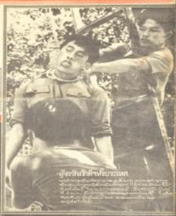
‘ราชา’ ค้ายาสงพัตติจนมูม

ดร.บุญธ.จับพวกกวนเมือง ประณามชาวสยามที่จับผิดคดี หมอ โทษว่าราชการและเปิดคดีใหม่ ณ ๘๖๖๖๖ บุญ พิธีกรรมใหม่ใด