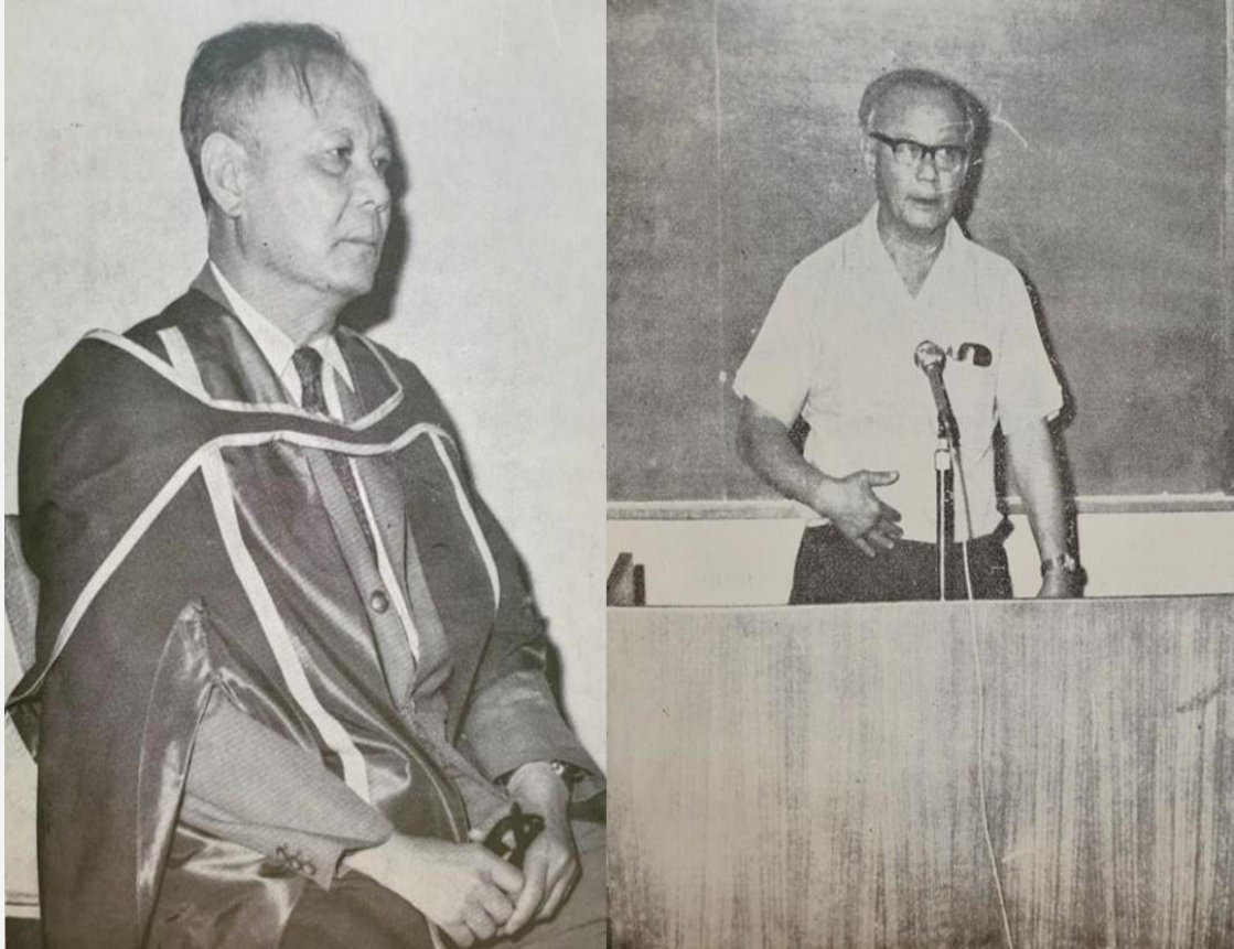
ป่วยในปี 2518 - 2519