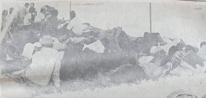
พิกัดอาแวง: ชาวมหาทยสืบจังหวัดพะยกัหม่น หลังกจากปะทังเป็นเวลายสิบกวัน ที่ห้องสนมหลวง.