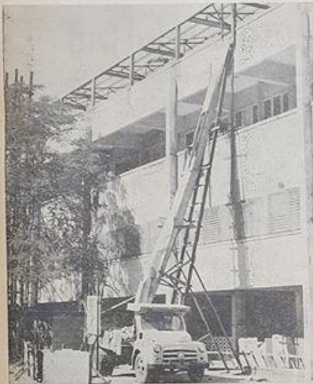
ปฏิรูปอาคาร บนคาบฟ้าของตึกสโมสร กำลังเร่งก่อสร้างเพื่อใช้เป็นที่พักของอาจารย์และเจ้าหน้าที่ของสถานวิทยุ ม.ธ. ส่วนนักศูนย์บัณฑิตอาสาสมัครและห้องสมุด.