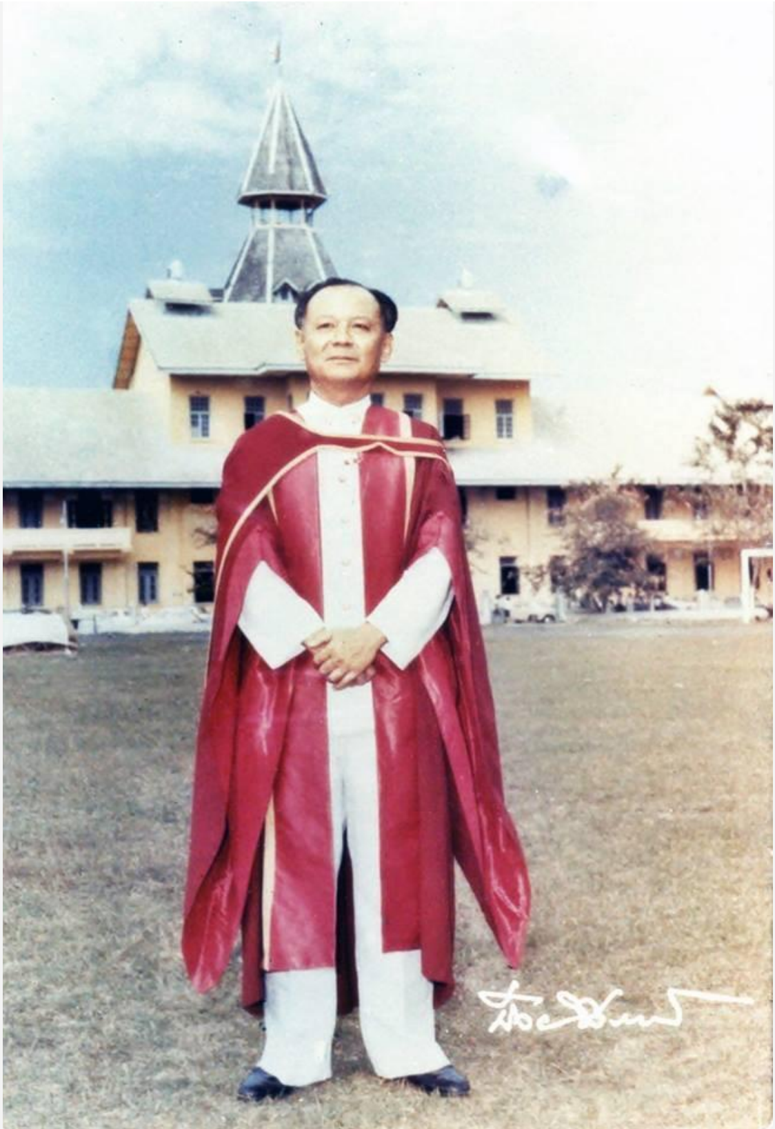
ป๋วยคือศิษย์เก่าคนแรกของมหาวิทยาลัยธรรมศาสตร์ที่กลับมาเป็นอธิการบดี