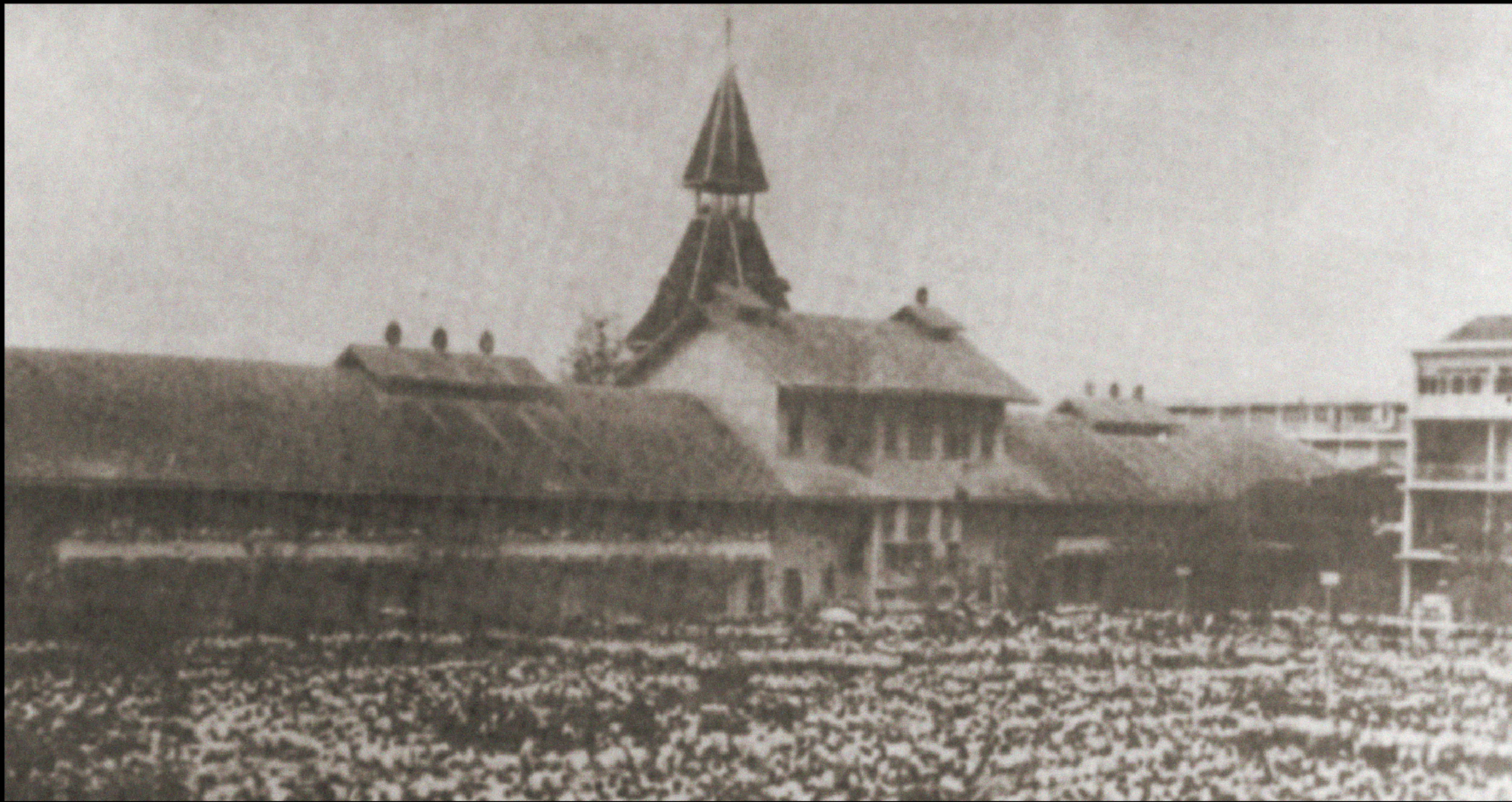
เหตุการณ์ 14 ตุลาคม The 14 th October Popular Uprising

22 กุมภาพันธ์ สภามหาวิทยาลัยลงมติ จัดตั้ง “สภาอาจารย์” ขึ้นเป็นครั้งแรก