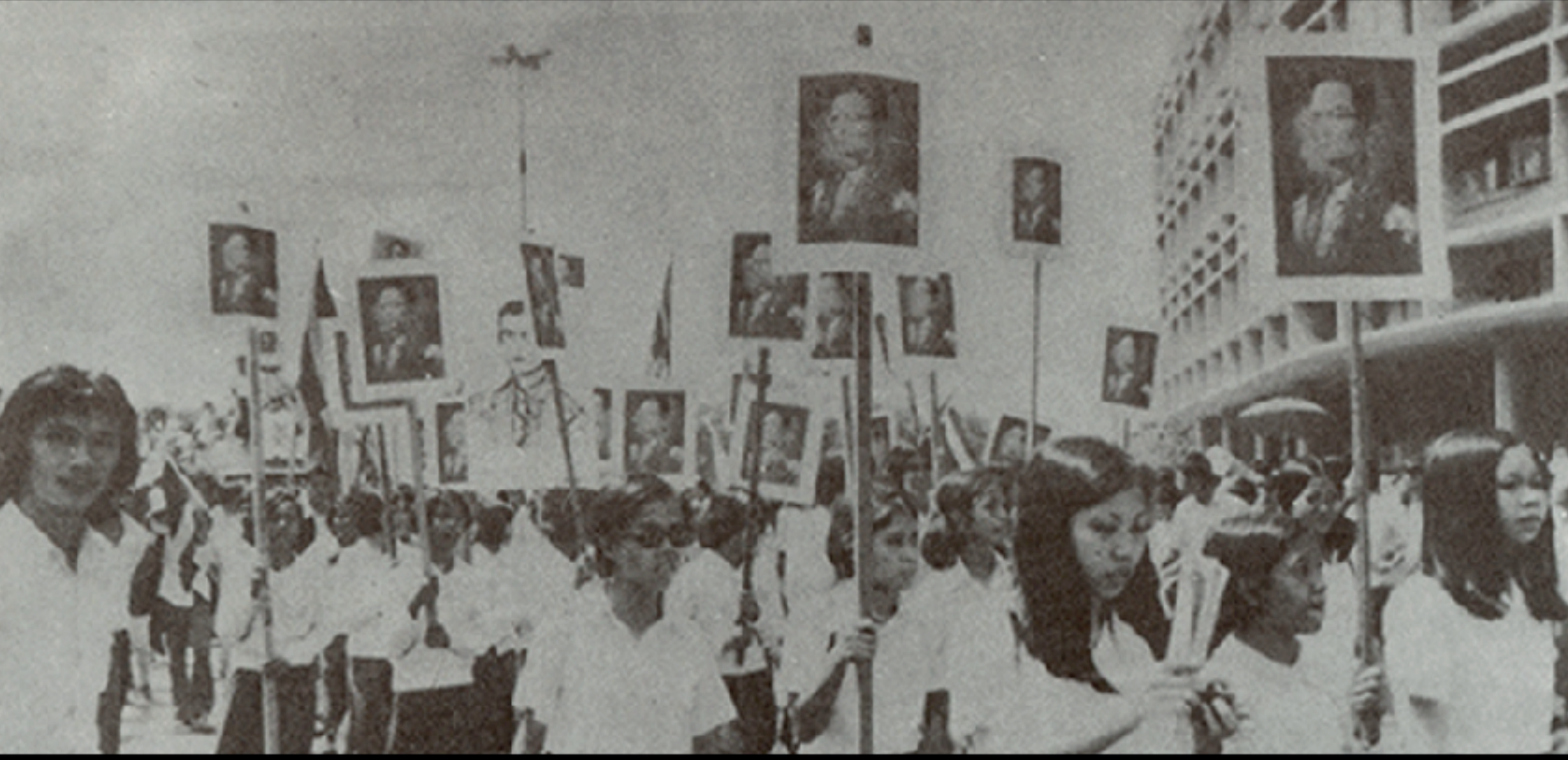
เปิดโปงกรณีท่งใหญ่เนเรศวร Exposure of the Thung Yai Naresuan Wildlife Sanctuary Case

“เหตุการณ์ 14 ตุลาคม” ปราบฎการณ์ทางการเมืองไทย ครั้งสำคัญ เริ่มต้นจากการชุมนุมที่บริเวณลานโพธิ์ของ มหาวิทยาลัย เป็นผลให้ต้องมีการประกาศเลื่อนสอบ และนำไปสู่เหตุการณ์ที่นักเรียน นักศึกษา และประชาชนร่วม แสนคน เดินขบวนออกจากมหาวิทยาลัยธรรมศาสตร์ไป ชุมนุมที่ถนนราชดำเนิน เพื่อเรียกร้องให้รัฐบาลปล่อยตัว ผู้ต้องหากลุ่มเรียกร้องรัฐธรรมนูญจนรัฐบาลเผด็จการ ต้องเดินทางออกนอกประเทศ เหตุการณ์ครั้งนี้มีผู้เสียชีวิต 71 คน บาดเจ็บ 857 คน และอธิการบดีมหาวิทยาลัย ธรรมศาสตร์ ศ. สัญญา ธรรมศักดิ์ ได้รับโปรดเกล้าฯ แต่งตั้งเป็นนายกรัฐมนตรี