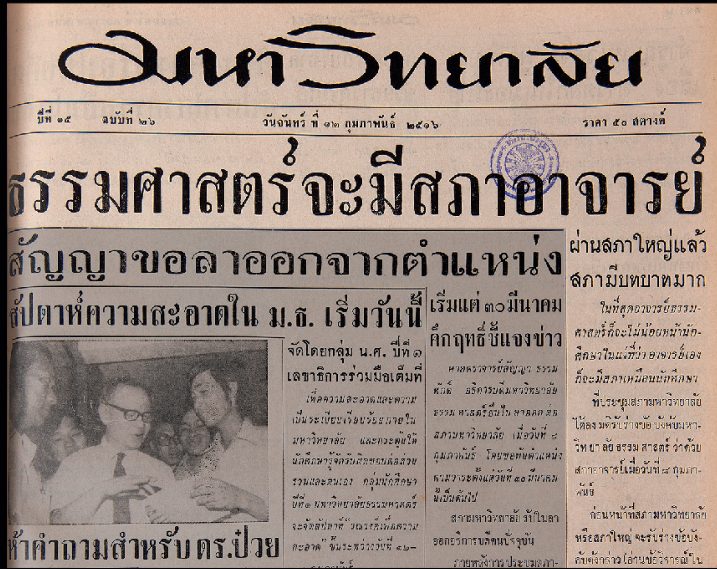
สภาอาจารย์ The “Teachers’ Council”

On 6 May, the “National Student Center of Thailand” called for a large demonstration to rally against the case in which government officials used army helicopters for hunting in the Thung Yai Preservation Park, exposing the Thung Yai case on 8 May to the public.