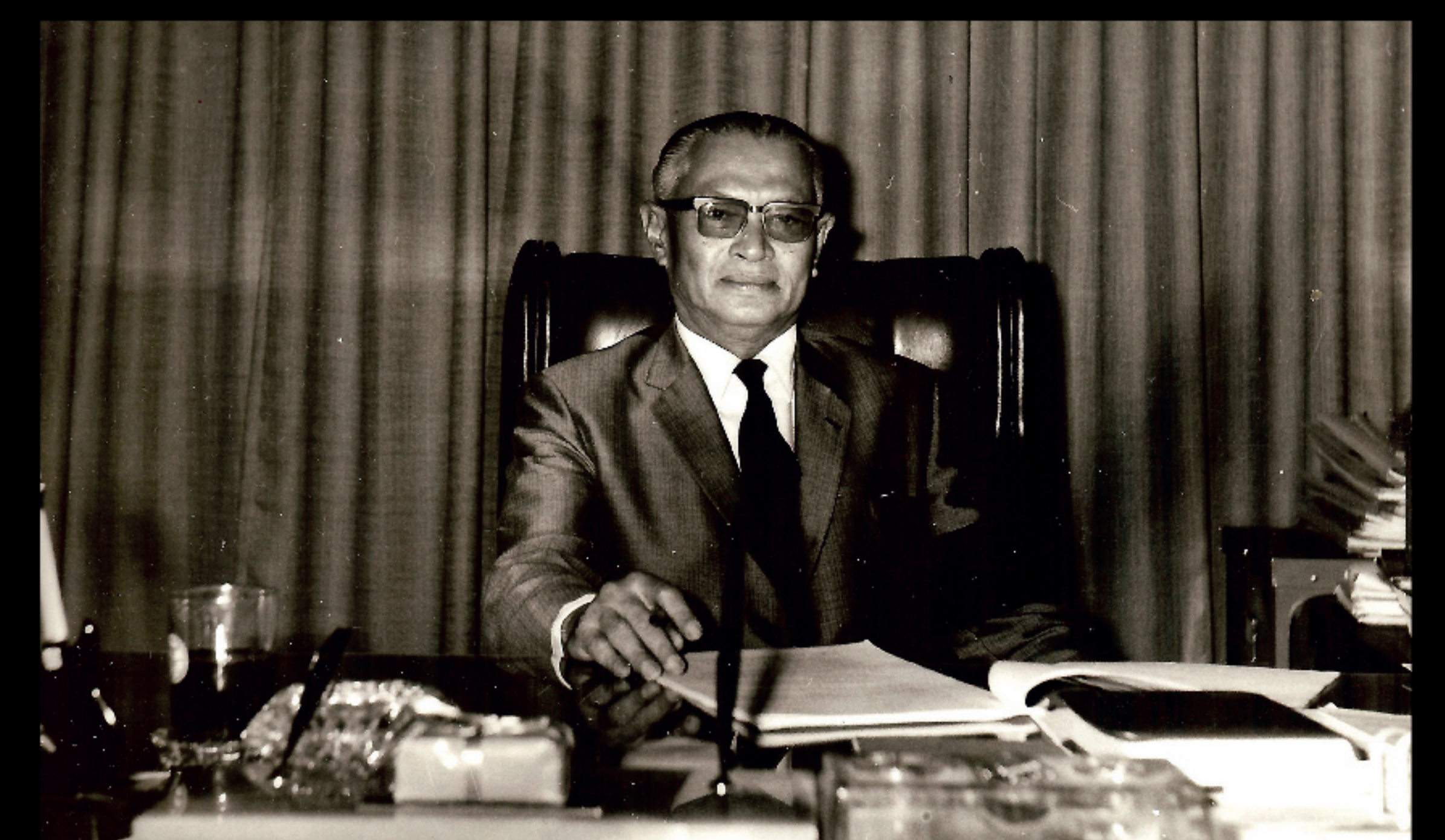
ศ. สัญญา ธรรมศักดิ์ Prof. Sanya Dharmasakti

The “Thai Khadi Research Institute” was established.