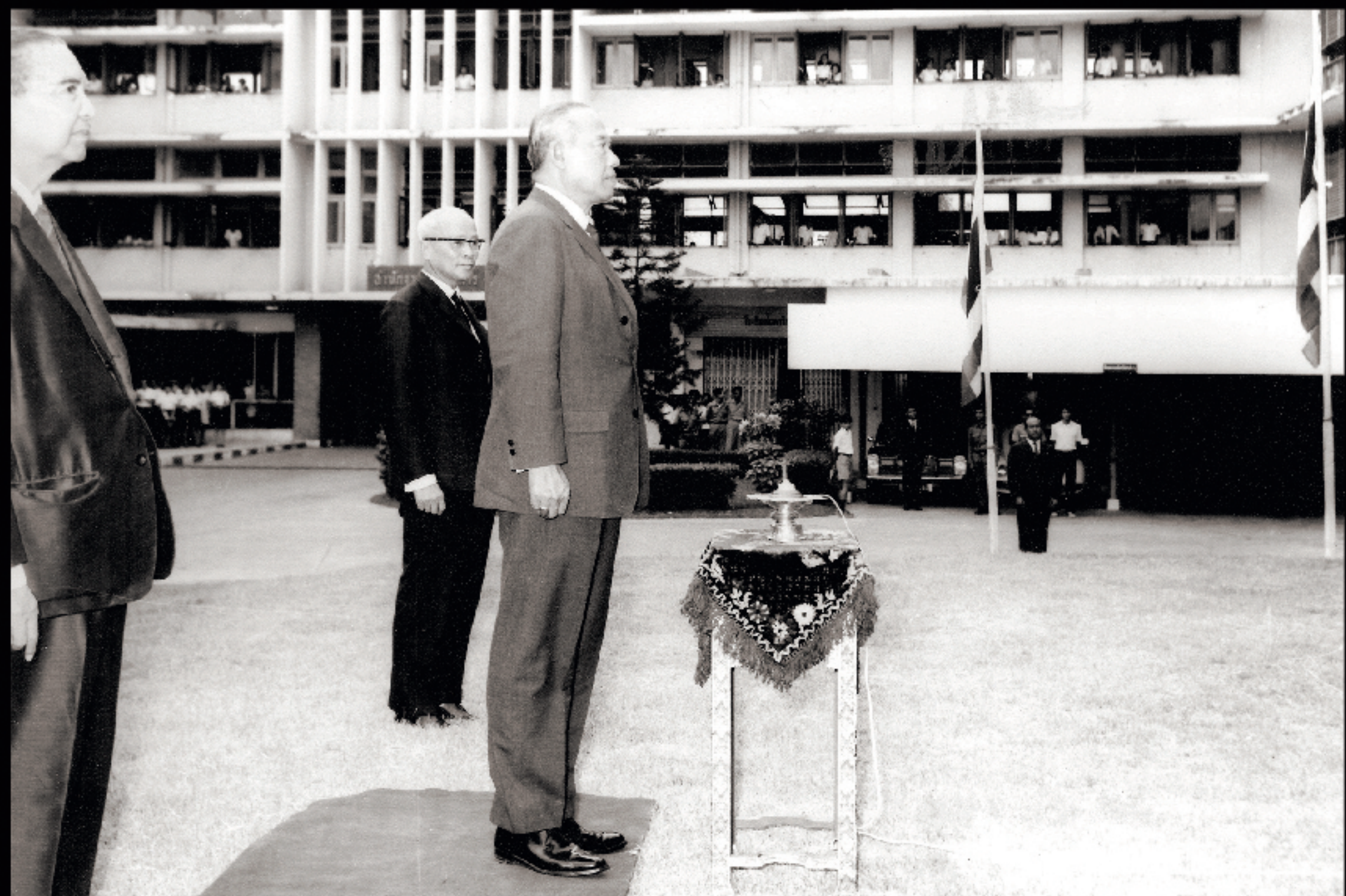
จอมพลถนอม กิตติขจร เป็นประธานในพิธีเปิดอาคารเรียนคณะรัฐศาสตร์ Field Marshal Thanom Kittikachorn presided over the Opening Ceremony of the Faculty of Political Science Building.

On 9 July, Field Marshal Thanom Kittikachorn, Prime Minister presided over the Opening Ceremony of the Political Sciences Faculty Building.